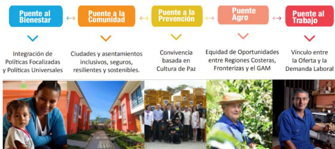
ILUSTRACIÓN 1. ABORDAJE INTEGRAL E INTERINSTITUCIONAL PUENTE AL DESARROLLO

El componente Puente al Bienestar busca garantizar que los 66.832 (sesenta y seis mil ochocientos treinta dos) hogares accedan a programas, proyectos y servicios sociales de forma preferente, articulada e integral para la reducción de la pobreza extrema; con base en la aplicación del nuevo modelo de intervención familiar implementado desde el IMAS.