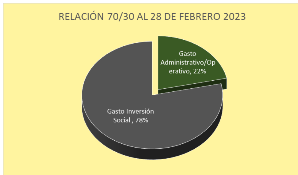
Gráfico No. 2 RELACIÓN 70/30 CIFRAS EN TÉRMINOS RELATIVOS

Para una mejor visualización a continuación se presenta la siguiente gráfica: