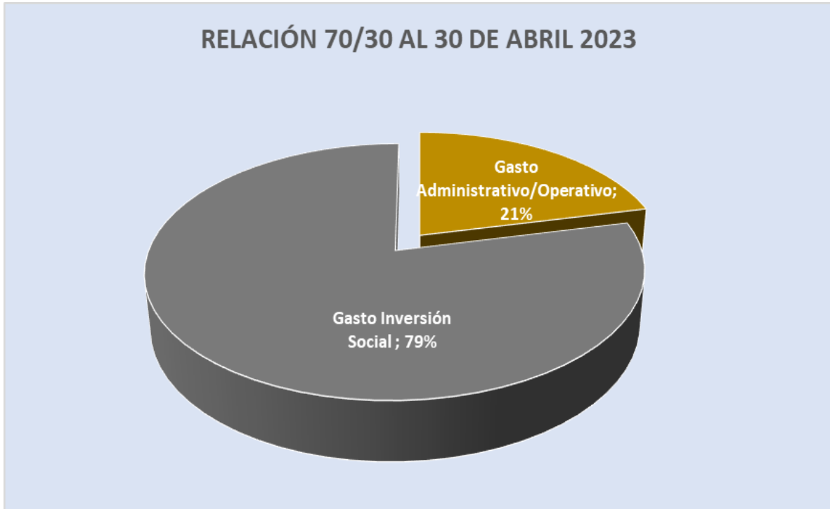
Gráfico No. 2 RELACIÓN 70/30 CIFRAS EN TÉRMINOS RELATIVOS

Para concluir con el análisis de la ejecución de los recursos presupuestados a la fecha, se hace necesario determinar el Superávit Real con el cual la institución finalizó el mes de abril del período 2023, para tal fin se presenta la siguiente información: