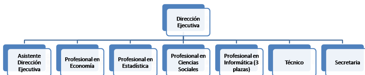
Figura 1 Organigrama Sistema Nacional de Información y Registro Único de Beneficiarios del Estado (SINIRUBE) 2017

De acuerdo a lo anterior, se presenta el organigrama del SINIRUBE para el año 2017: