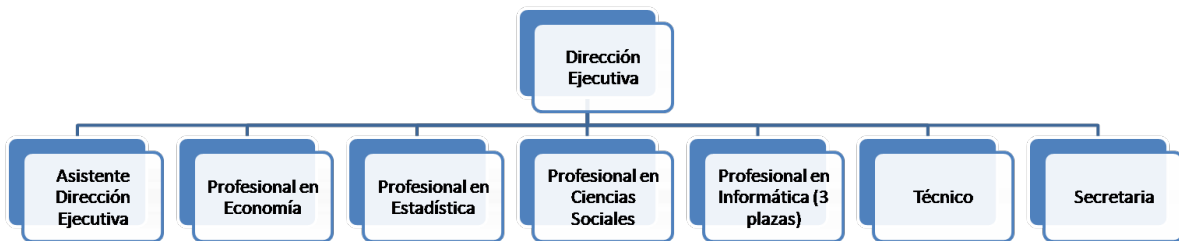
Figura 1 Organigrama Sistema Nacional de Información y Registro Único de Beneficiarios del Estado

El SINIRUBE cuenta con una estructura organizativa definida y aprobada, misma que busca el cumplimiento de las tareas encomendadas al SINIRUBE, según lo siguiente: