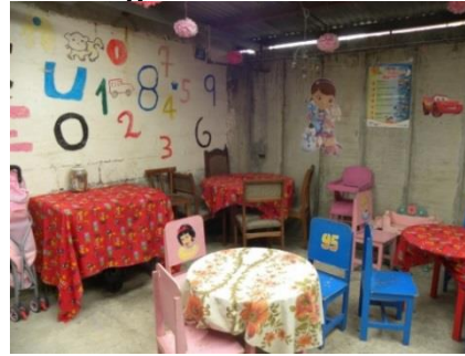
Imagen N.º 4 Hogar Comunitario