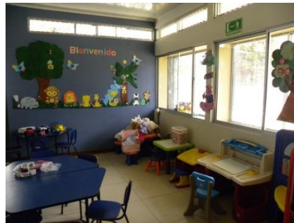
Imagen N.º 3 CECUDI

CEN-CINAI, con las estructuras de los CECUDI, éstos últimos centros han sido edificados en los últimos 4 años, y se encuentran en excelentes condiciones físicas y con espacios idóneos para el desarrollo de los niños y las niñas tanto en el aspecto pedagógico como lúdico. De seguido se incluyen imágenes de un CECUDI y un Hogar Comunitario visitados para ilustrar las diferencias en comentario. (En el Anexo N.º 3 se muestran fotografías adicionales sobre este tema).