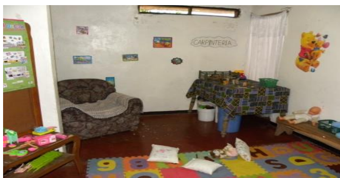
Imagen N.º 2 Hogar Comunitario